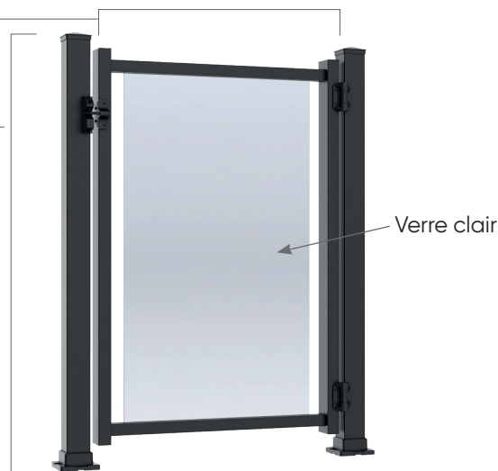
À partir du sol